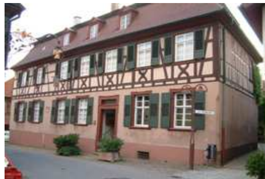
Reblandmuseum in Steinbach